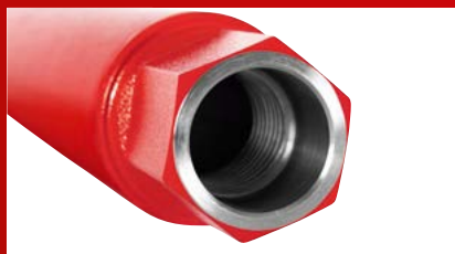
Adapter s navojem 1,1/4" UNC s velikim ispušnim otvorom